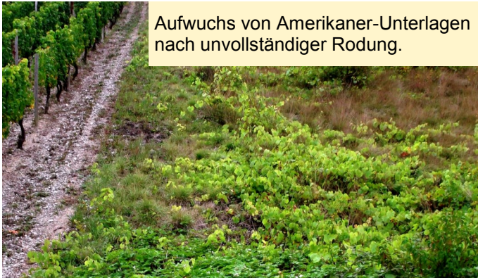
Aufwuchs von Amerikaner-Unterlagen nach unvollständiger Rodung.

Mit dem Strukturwandel und der Rationalisierung im Weinbau sind vielerorts schwer bewirtschaftbare oder abgelegene Rebflächen aus der Produktion gefallen. Die Folge ist, dass bei unterlassener oder nicht sachgemäßer Rodung solcher Flächen vielfach Wildwuchs mit Reben vorliegt.