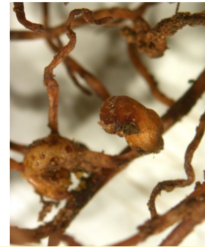
Wurzelrebläuse verursachen Missbildungen und Verwachsungen an der Wurzel mit der Gefahr von Fäulnisbildung.

Hiergegen ist die Amerikanerrebe relativ widerstandsfähig, während Wurzeln von Europäerreben (z. B. in Form von Schleifreben oder von Edelreiszurzeln) hoch anfällig sind.