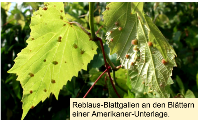
Reblaus-Blattgallen an den Blättern einer Amerikaner-Unterlage.

Meist handelt es sich dabei um den Aufwuchs des europäischen Edelreises der Weinrebe. Auf bereits vor Jahren gerodeten Anlagen oder nicht sorgfältig gerodeten Anlagen ist aber immer wieder auch Austrieb von Amerikaner-Unterlagen zu beobachten (Stockausschläge bei unvollständiger Rodung des Wurzelwerks). Diese sind hoch anfällig für Blattrebläuse und damit kann sich der Entwicklungskreislauf der Reblaus schließen.