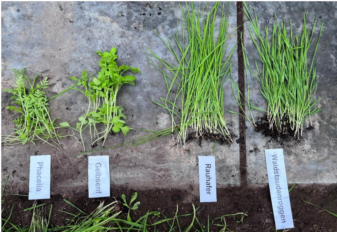
Bild 2: die aussichtsreichsten Varianten im Glashaus (von links nach rechts: Phacelia, Gelbsenf, Rauhafer, Waldstaudenroggen)