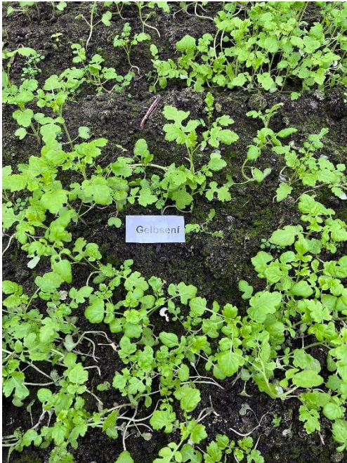
Bild 4: Gelbsenf im Glashaus (24.01.2023)