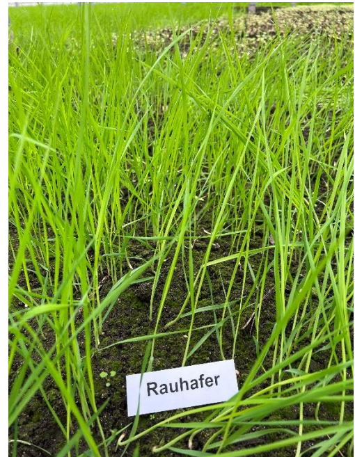
Bild 6: Rauhafer im Glashaus (24.01.2023)