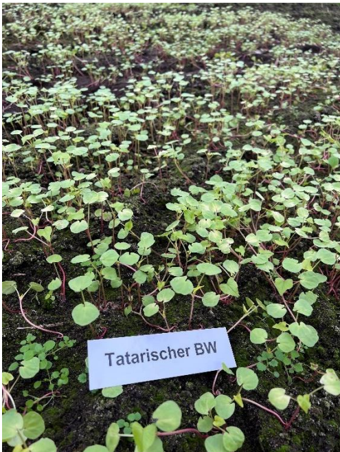
Bild 7: Tatarischer Buchweizen im Glashaus (24.01.2023)