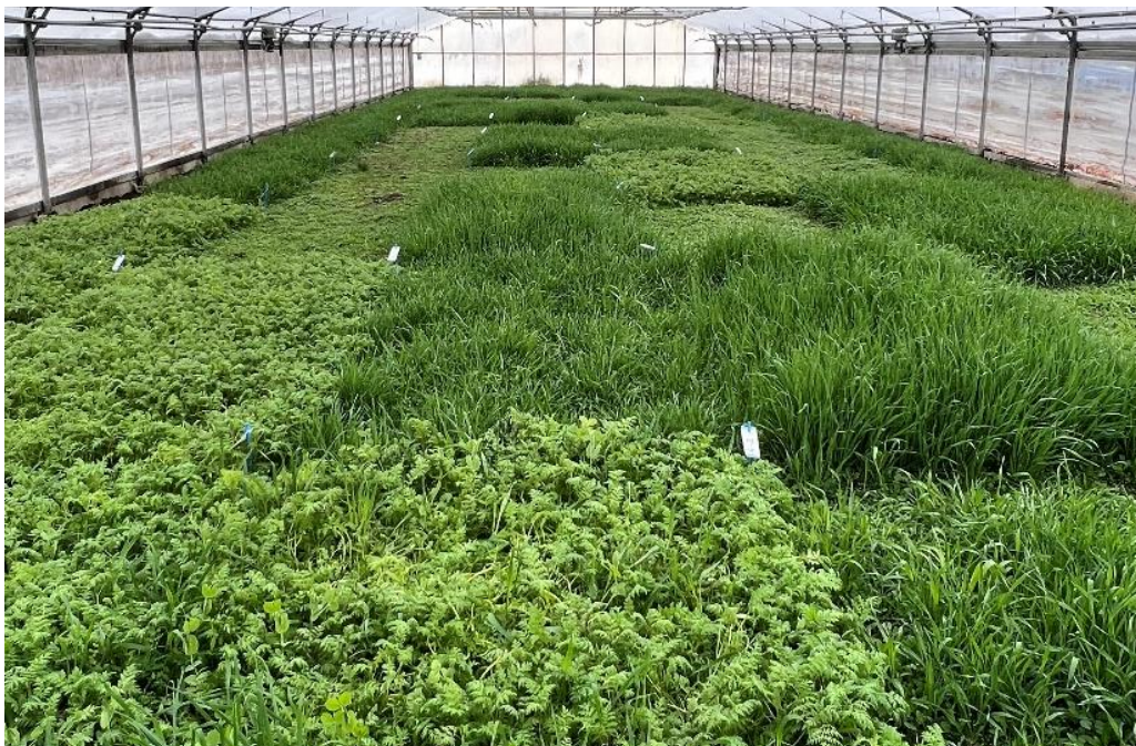
Bild 3: Blick auf die Versuchsfläche Folie am 28.02.2023

Anschließende Untersuchungen der Trockenmasse der vier Varianten gaben Aufschluss über das Nährstoffaufnahmepotential. Der Gesamtstickstoff nach Dumas beinhaltet alle organisch und anorganisch gebundenen Stickstoffverbindungen.